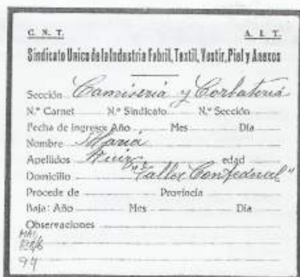
Un exemple de Carnet Sindical (C.N.T.)