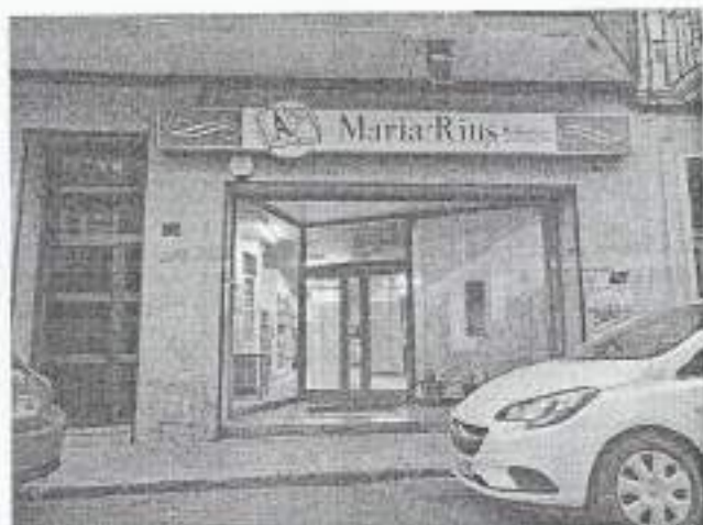
Biblioteca Maria Rius a Lleida / Anxi dels autors.