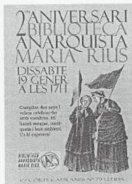
Cartell de la Celebració del Segon Aniversari de la Biblioteca Maria Rius / Anxi de la Biblioteca Maria Rius.