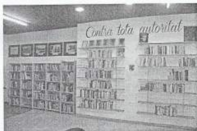
Interior de la Biblioteca Maria Rius de Lleida / Anxi de la Biblioteca Maria Rius.