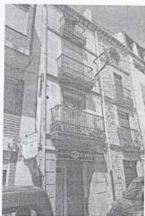
Linda de la porta amb la inscripció de la Notaria dels Riu al carreró de Sant Feliu d'Arbeca.