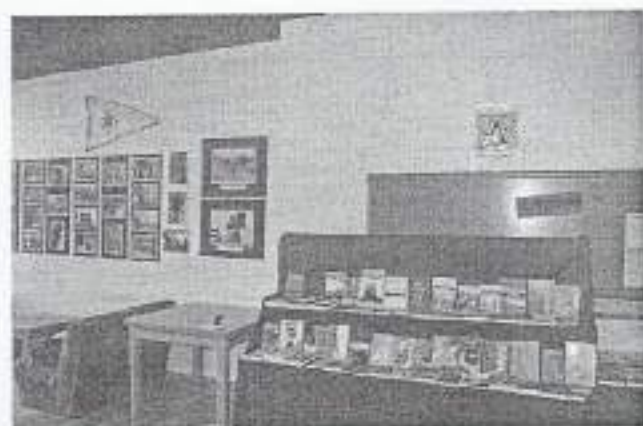
Interior de la Biblioteca Maria Rius de Lleida / Anxi de la Biblioteca Maria Rius.